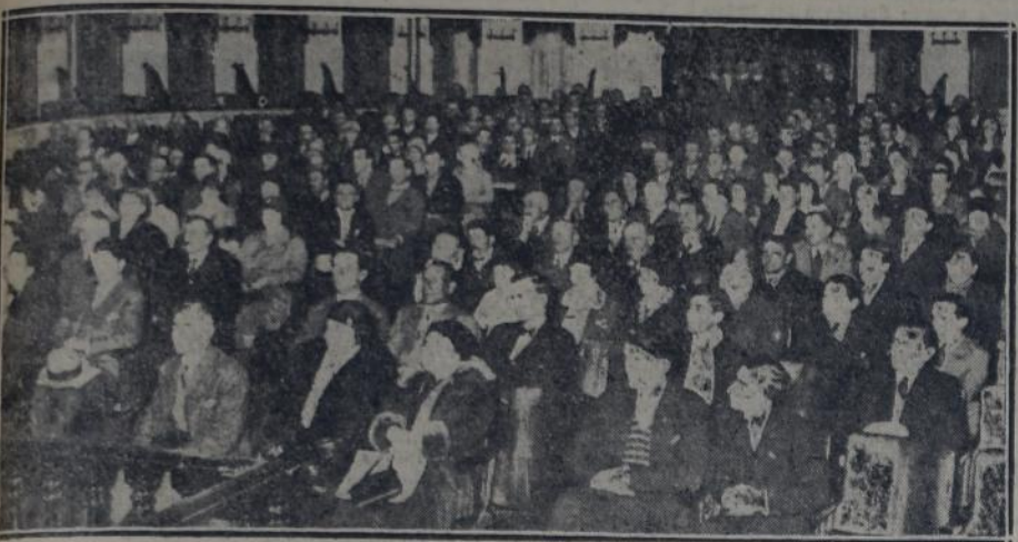
ASPECTO QUE PRESENTABA LA SALA DEL TEATRO MARCONI

El acto transcurrió dentro de un marco entusiasta, viéndose la presencia de relativa cantidad de mujeres, que dio elocuentemente el interés que la iniciativa despertó en las mismas. Luego presidió de una campaña interesante y noble.